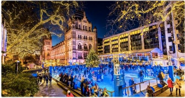
Pista del Museo de Historia y de Canary Wharf