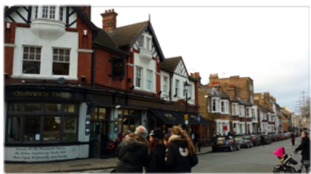
Calles de Greenwich