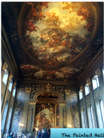
The Painted Hall

Si te sitúas en la parte central, entre un edificio y otro, verás al fondo la Casa de la Reina. Dirígete hacia allí. Esta casa pertenece hoy al Museo Nacional Marítimo ( http://www.rmg.co.uk/national-maritime-museum ), justo al lado.