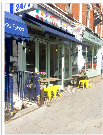
Angie's Little Food

no quieres hacerlo en el súper, o comer en algunos de sus muchos restaurantes. Están las cadenas de restaurantes habituales, como Byron, Zizzi, Bill's (éste con cuidadosa decoración), Pizza Express, Nando's y otros más exclusivos como Carvossos's ( http://www.carvossosat210.co.uk ) donde puedes organizar hasta cenas para los tuyos en su salón privado, Jackson + Rye ( http://www.jacksonrye.com ), el nuevo Chiswick Fire Station ( http://www.no197chiswickfirestation.com/#home-197 ), High Road Brasserie ( https://www.highroadhouse.co.uk ) que además de ser uno de los famosos restaurantes del barrio, cuenta con espacios para reuniones privadas y habitaciones en el hotel, The Cabin ( http://www.cabinrestaurants.co.uk ) y podría no parar.