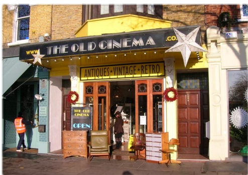
The Old Cinema

Miles de calles componen el barrio de Chiswick, algunas con casas preciosas y muy buenas. Puedes perderte por ellas y dar paseos muy agradables y probablemente en soledad pues no