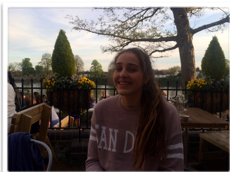
The Bell & Crown