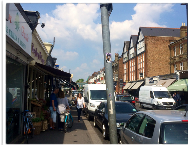
Turnham Green Terrace

Esta zona, es la parte más bonita de la calle, donde puedes pasear en sus anchas aceras, ver los escaparates, comprar flores en los diversos y preciosos puestos que encuentras, comprar también las verduras si