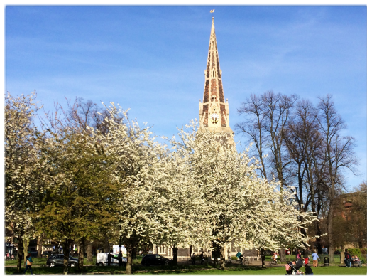
Parque Turnham Green con su iglesia