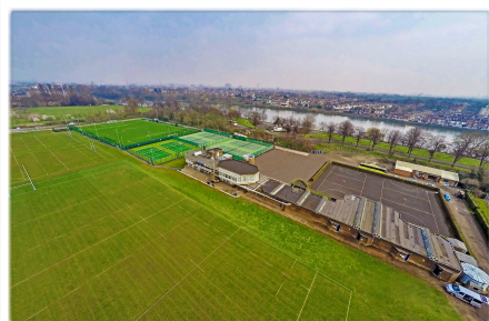
King's House Sports Ground

Cerca de este parque, hay un centro grande de deportes. Está al lado del río. Es el King's House Sports Ground ( http://www.kingshousesportsground.co.uk ). Tiene muchísimos campos de fútbol y algunas pistas de tenis y justo al lado está el club deportivo Chiswick Riverside Health & Racquet Club ( https://www.virginactive.co.uk/clubs/chiswick-riverside ). Ambos una opción indiscutible para hacer deporte.