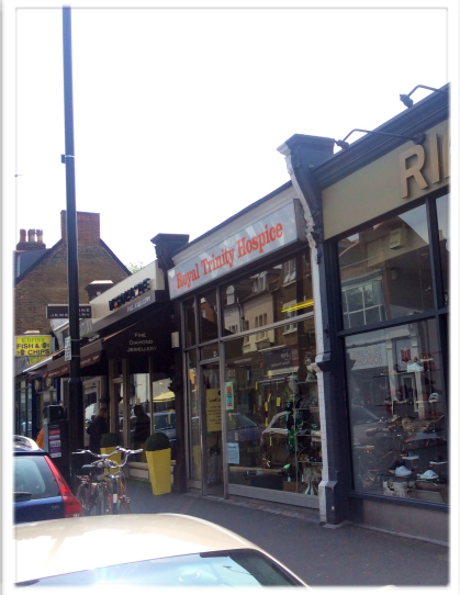
Royal Trinity Hospice Shop

todo, me gustó el especial cuidado que ponen en sus platos y ¡lo buenos que están! Cosa no siempre fácil en este país.